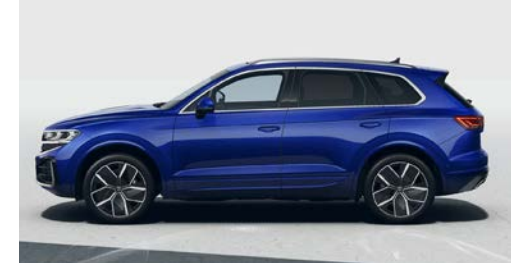
Yarış mavisi* metalik L9 O