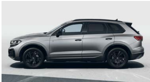
Mat granit grisi* metalik 9D O