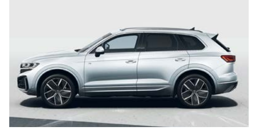
İstiridye gri metalik F0 O