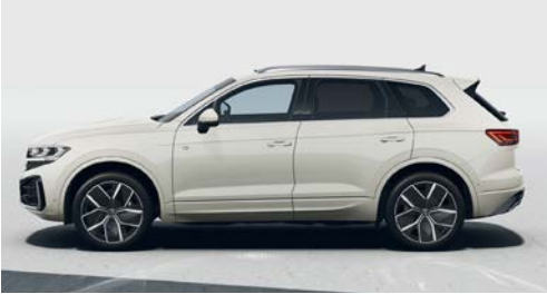
Sechura beji metalik 5Q O