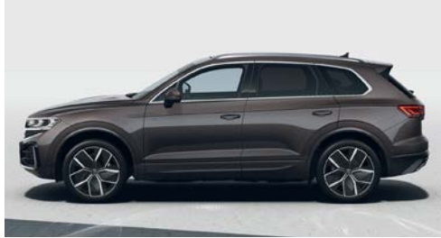
Terrarossa kahve metalik 3V O