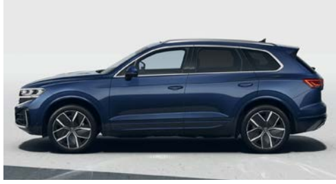
Derin lacivert metalik D6 O