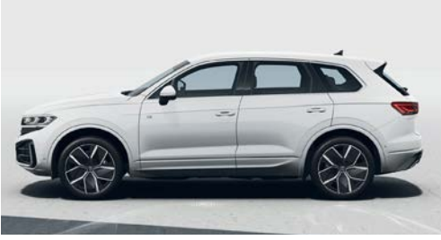
Saf beyaz opak 0Q S