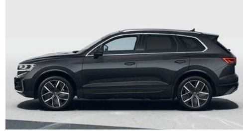
Abanoz siyah metalik 0E O