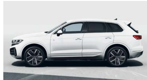
Oryx beyazı sedefli 0R O

Bu sayfalardaki görseller yalnızca fikir verme amaçlıdır ve gerçek görüntülerle farklılık gösterebilir.