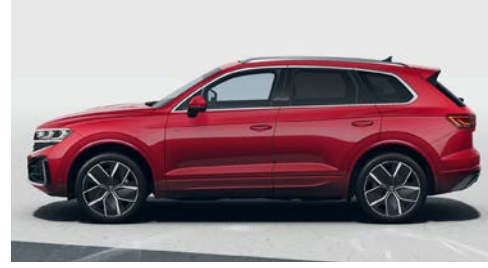
Kızılıcak kırmızı metalik W0 O