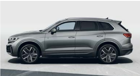
Granit grisi metalik 3M O