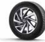
Highline 17'' Woodstock alüminyum alaşımlı jant