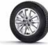
Comfortline 16'' Clayton alüminyum alaşımlı jant