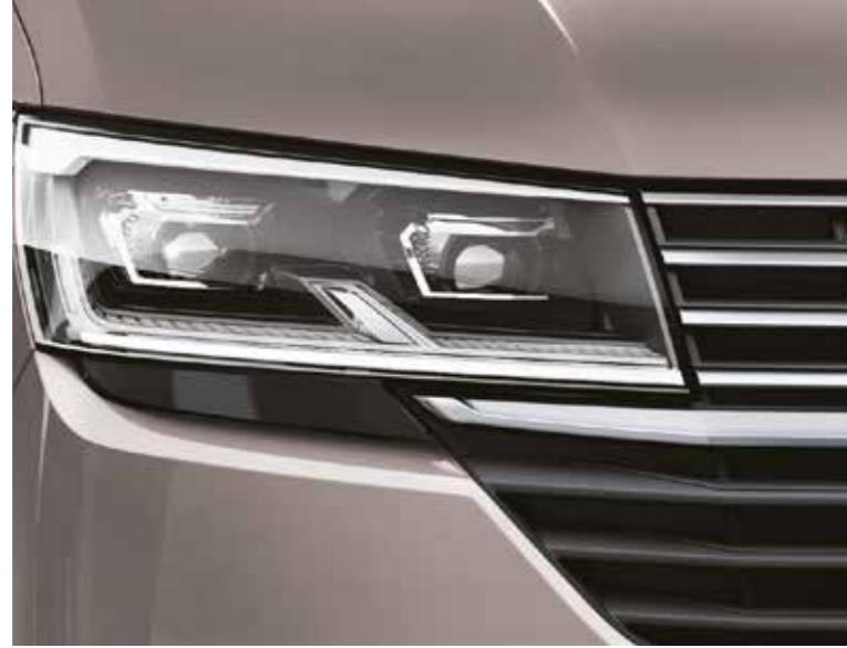
Otomatik seviye ayarına sahip LED ön far ve arka stoplar

Otomatik seviye ayarına sahip LED farlar gün ışığına çok yakın bir renkte aydınlatma sağladığı için sürüş konforunu ve güvenliğini artırıyor.