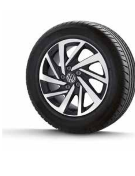
17" Woodstock alüminyum alaşımlı jantlar Caravelle Highline'ın şık görünümünü tamamlıyor.

"Bulli" Almancada güçlü-kuvvetli anlamına geliyor ve Bulli logosu T1'den beri kullanılıyor. Caravelle Highline'da da önceki jenerasyonlarda olduğu gibi "Bulli" logosu ön çamurluklarda kendini gösteriyor.