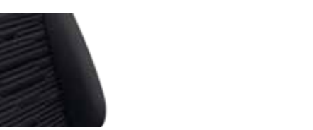
Circuit (koltuk kumaşı)