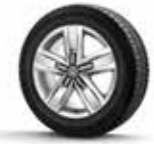
Highline 4Motion 17'' Devonport alüminyum alaşımlı jant