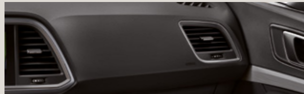
KIRMIZI DİKİŞLİ SİYAH KUMAŞ / DINAMICA®