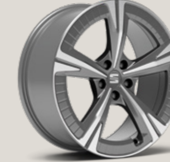
19" AERO NÜKLEER GRİ EXCLUSIVE 36/5 MACHINED XP