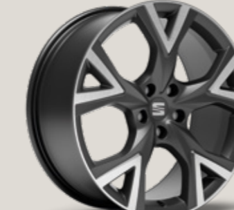
19" COSMO GRİ EXCLUSIVE 36/9 MACHINED FR