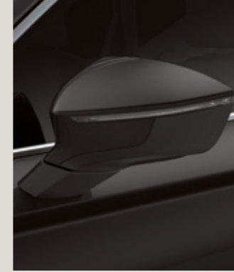
MAGIC SİYAH 2