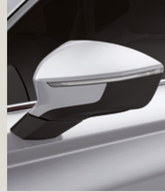
NEVADA BEYAZ 2