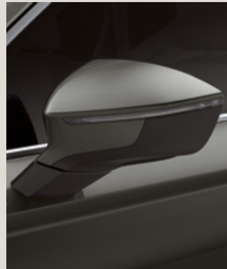
KAMUFLAJ YEŞİLİ 3