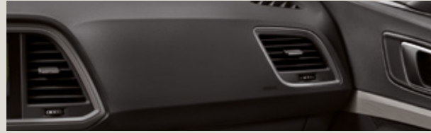
GRİ / SİYAH KUMAŞ / DINAMICA®