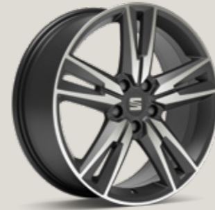
18" COSMO GRİ PERFORMANCE 36/3 MACHINED FR