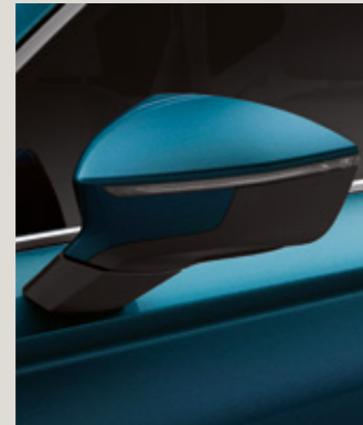
LAVA MAVİ 2