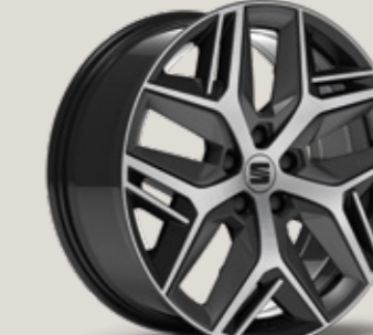
19" PARLAK SİYAH EXCLUSIVE 36/10 FR