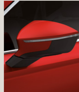
VELVET KIRMIZI 3