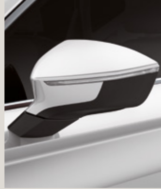
BILA BEYAZ 1