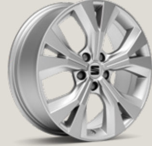
18" GRİ PERFORMANCE XP