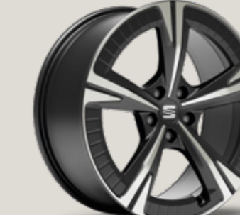
19" AERO COSMO GRİ EXCLUSIVE 36/6 MACHINED FR