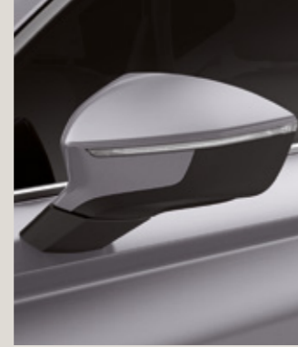
BRILLIANT GÜMÜŞ GRİ 2