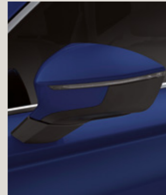
ENERJİ MAVİ 1