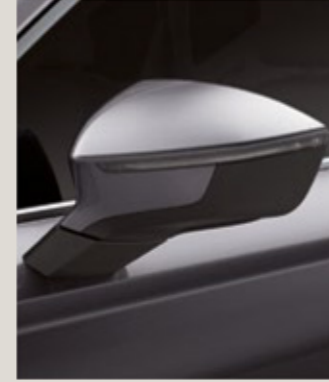
GRAFİT GRİ 2