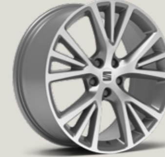
19" AERO NÜKLEER GRİ EXCLUSIVE 36/4 MACHINED XP